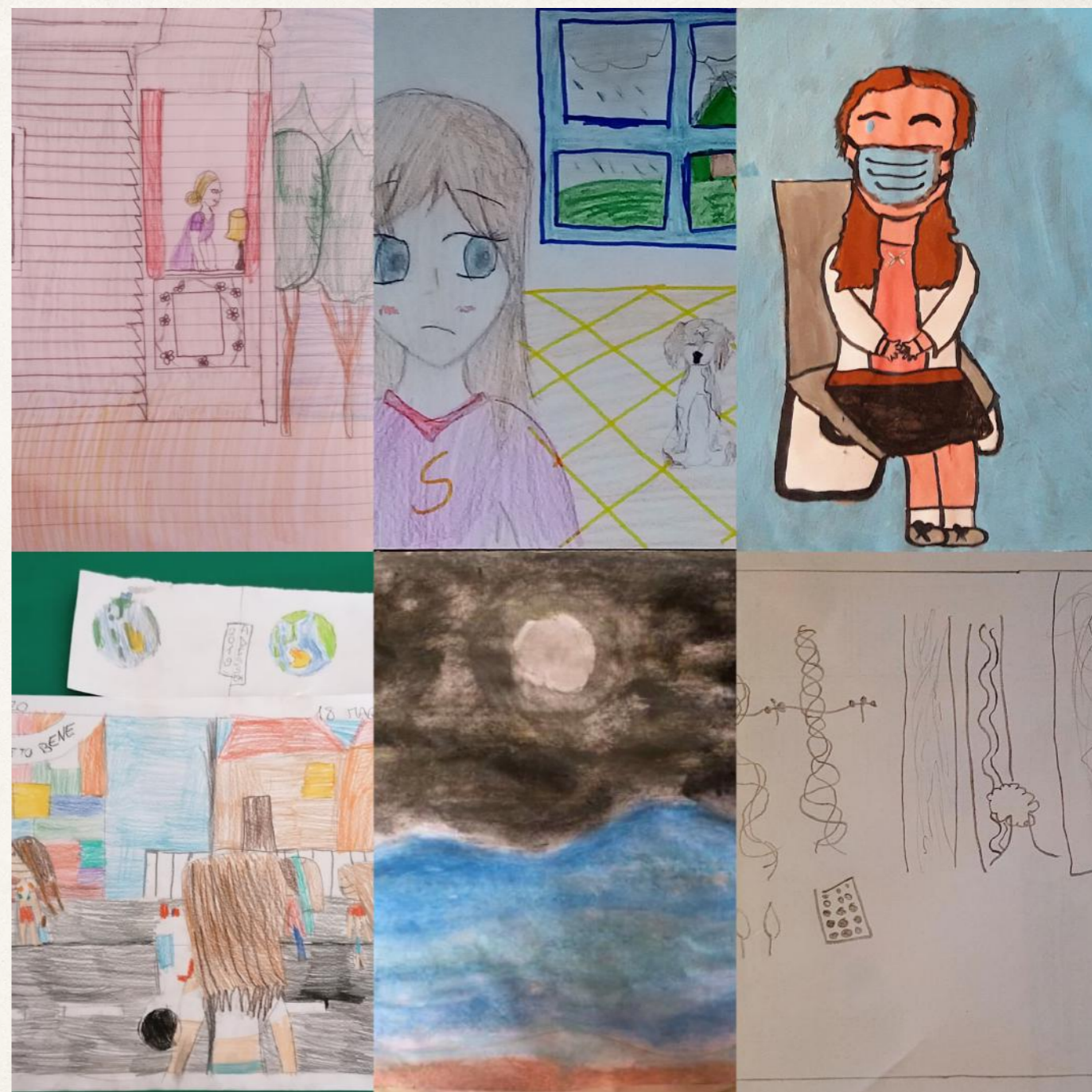
Disegni degli alunni e alunne della classe VB del Plesso "Don Milani" A.S. 2019/2020