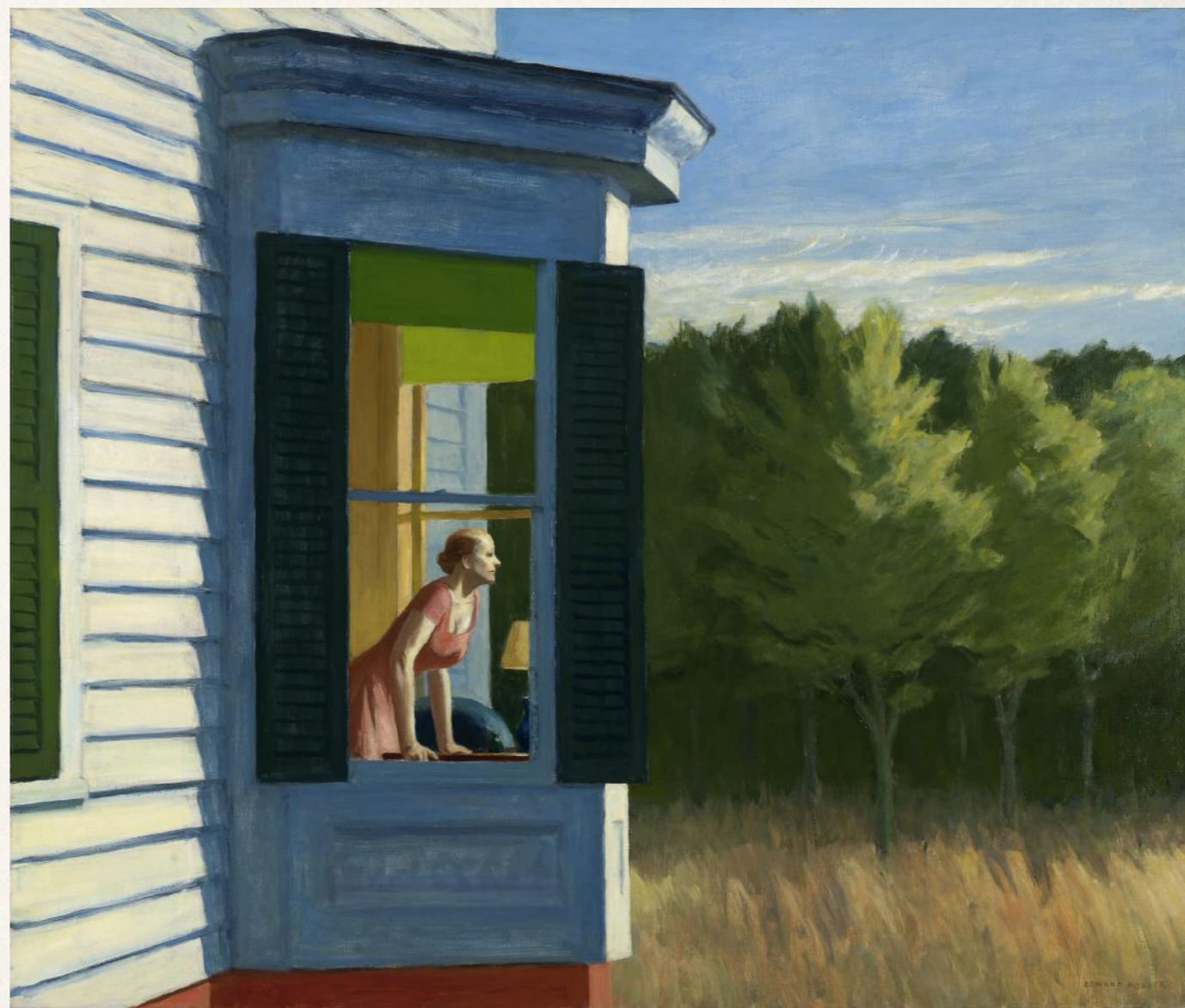
Edward Hopper, Cape Cod Morning, 1950.

Il lavoro finale costituisce una preziosa testimonianza di come gli alunni hanno vissuto la critica fase dell'emergenza sanitaria.