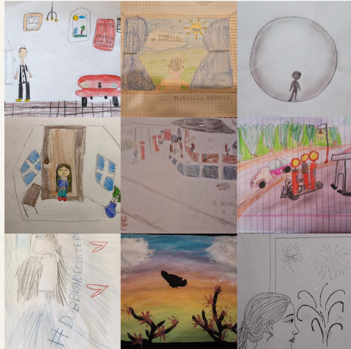
Disegni degli alunni e alunne della classe VB del Plesso "Don Milani" A.S. 2019/2020