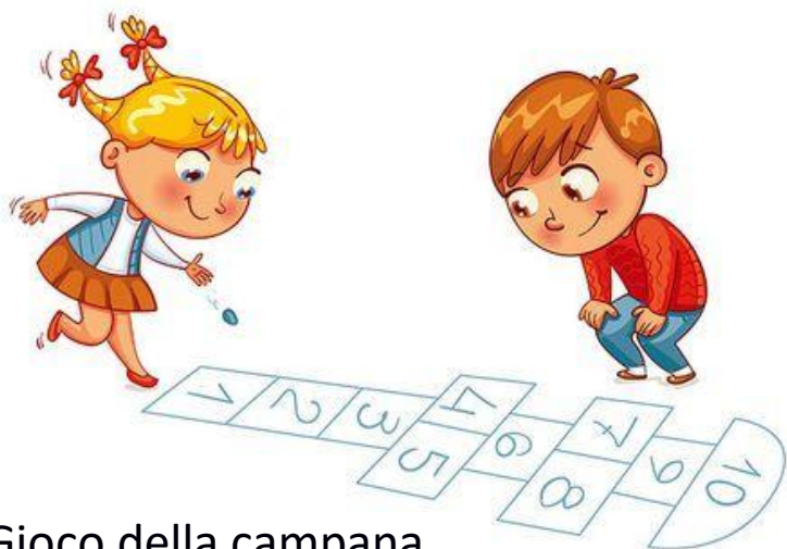
Gioco della campana