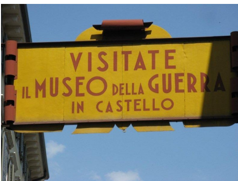
Il Museo della Grande Guerra