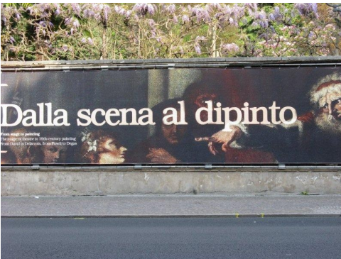
Poi nel pomeriggio tutti al MART