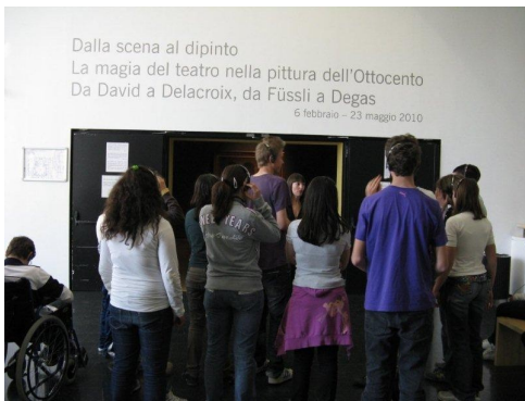
Il MART: la mostra e la visita guidata