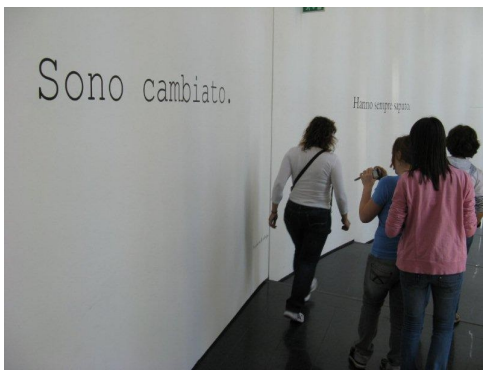
Il MART: la mostra permanente