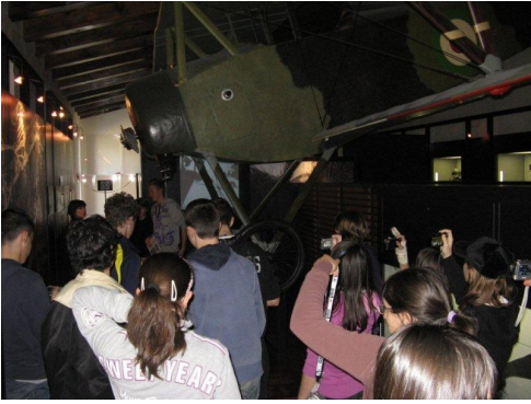
Una sala del Museo della Grande Guerra