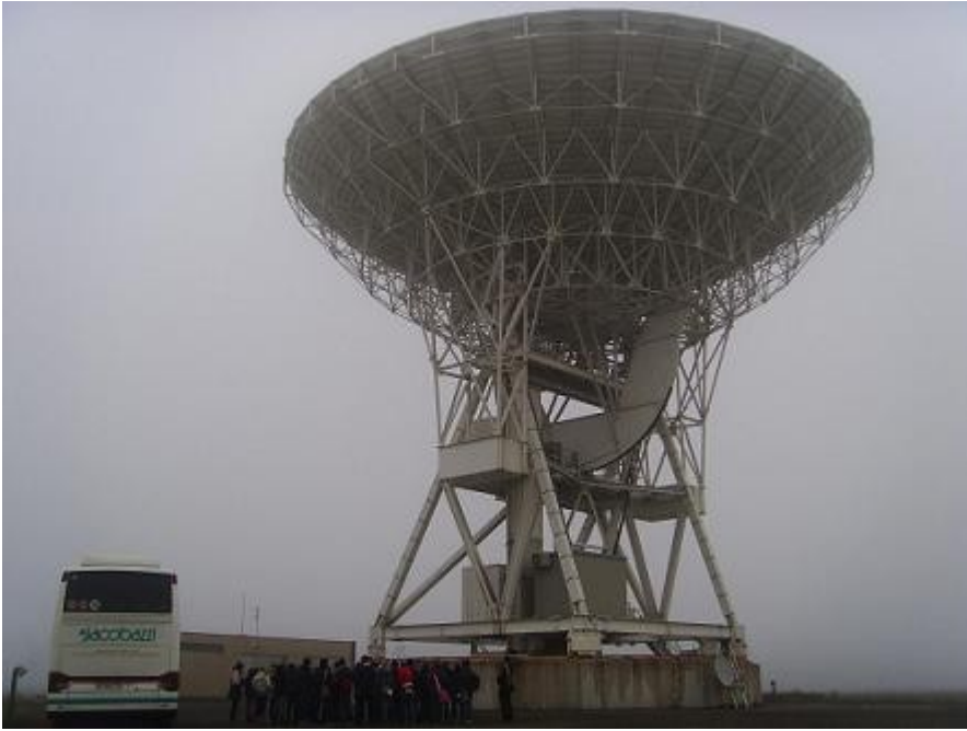
Visita a uno dei radiotelescopi di Medicina