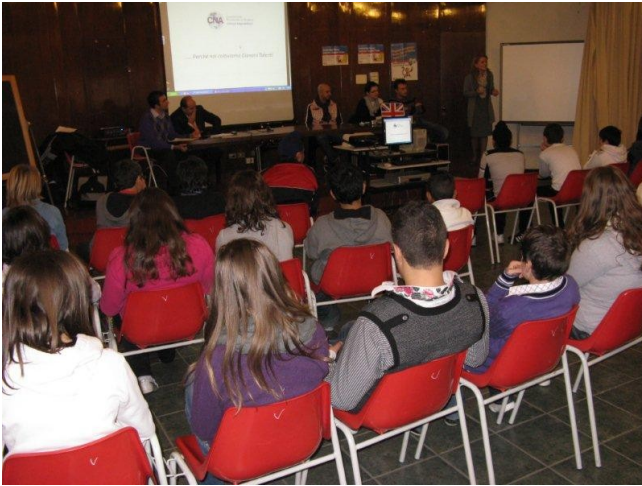
L'incontro con i mestieri del CNA