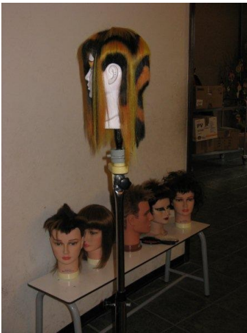
Uno dei mestieri: il parrucchiere