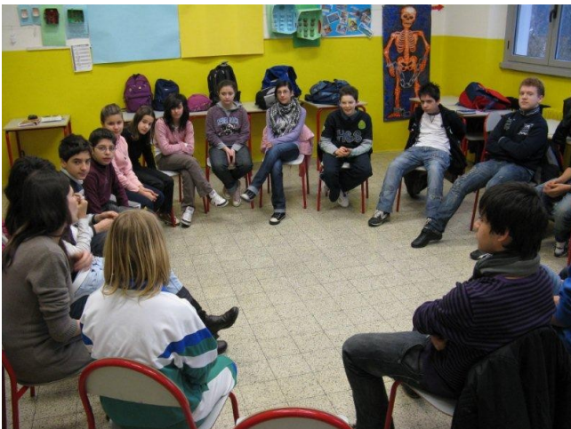
Uno degli incontri con la Psicologa