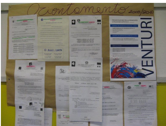
La nostra bacheca degli Open Day