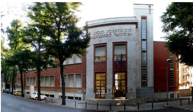
Alcune tra le scuole più visitate da alunni e genitori

Poi in inverno sono iniziati gli Open Day delle Scuole Superiori