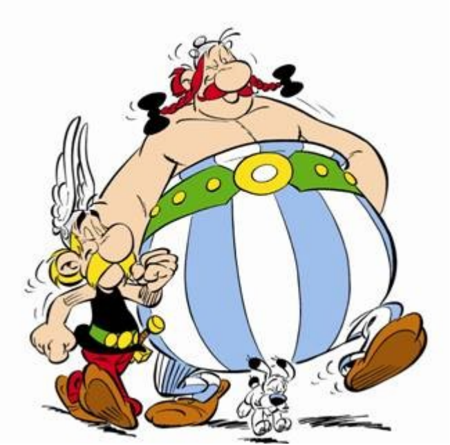
Famosi nemici dei Romani