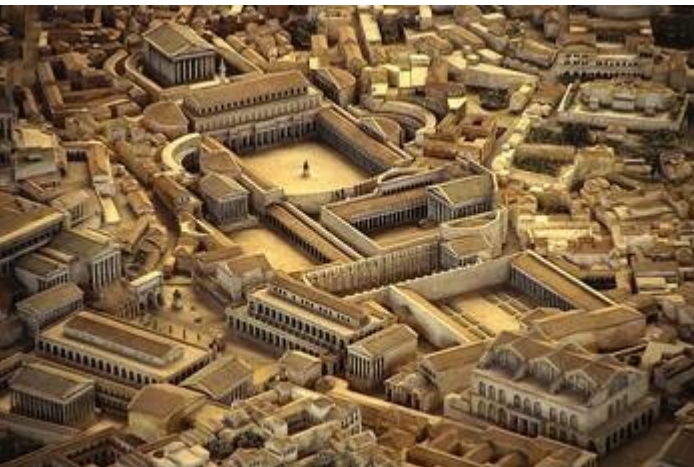
Come dovevano essere i Fori Imperiali