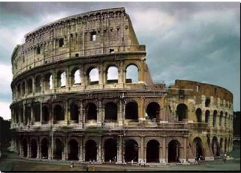
Il Colosseo, Roma