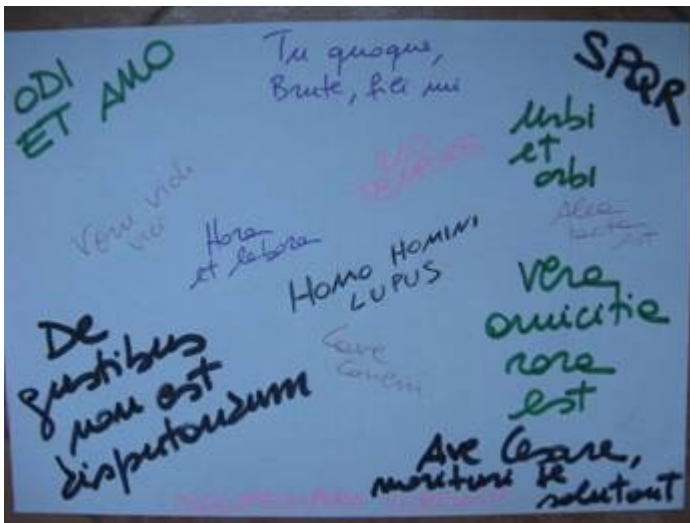
Alcune delle frasi commentate e imparate