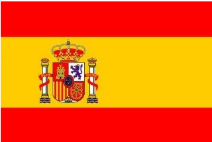
La bandiera della Spagna