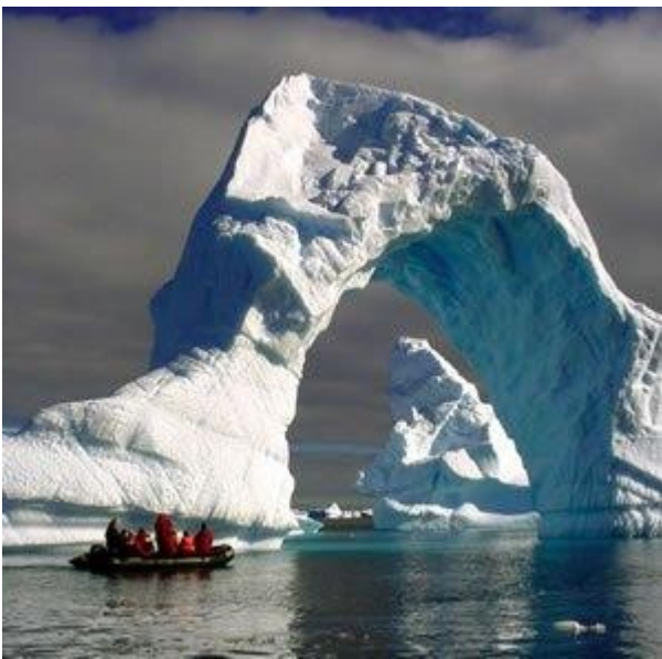
Studiosi italiani al lavoro in Antartide