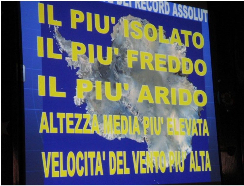
I record dell'Antartide