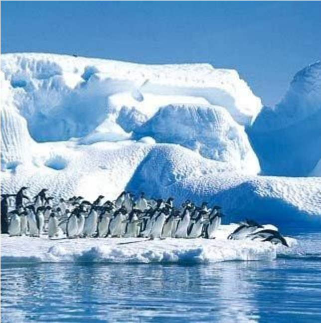
I veri abitanti dell'Antartide