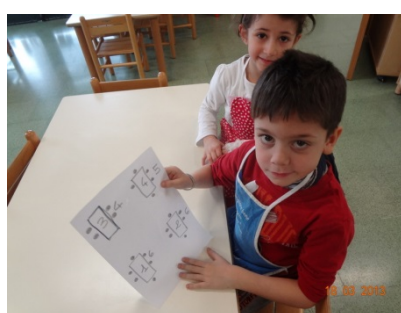
PIANTINA "APPARECCHIATURA" TAVOLI