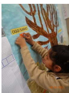
APPLICAZIONE TESSERE MOBILI CORRISPONDENTI