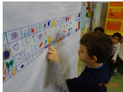
CONTEGGIO PRESENTI SUL PANNELLO