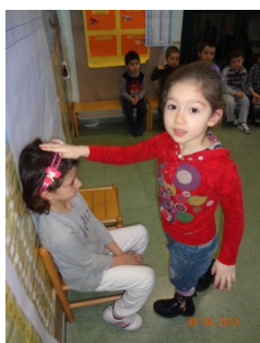
VERIFICA DEI PRESENTI