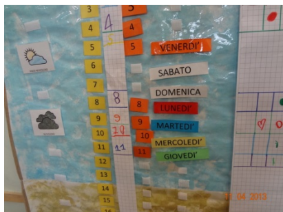
ESEMPIO PANNELLO COMPLETATO